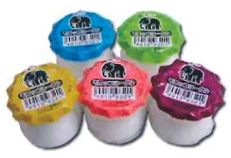
モロッコヨーグル