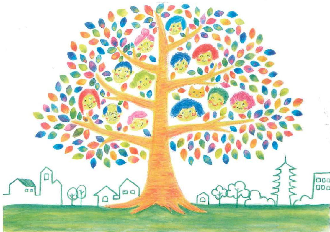
イラスト・松田京子

発行 社会福祉法人京都福祉サービス協会 総合福祉施設 塔南の園 (とうなんのその)