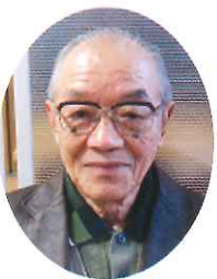
塔南の園福祉後援会会長